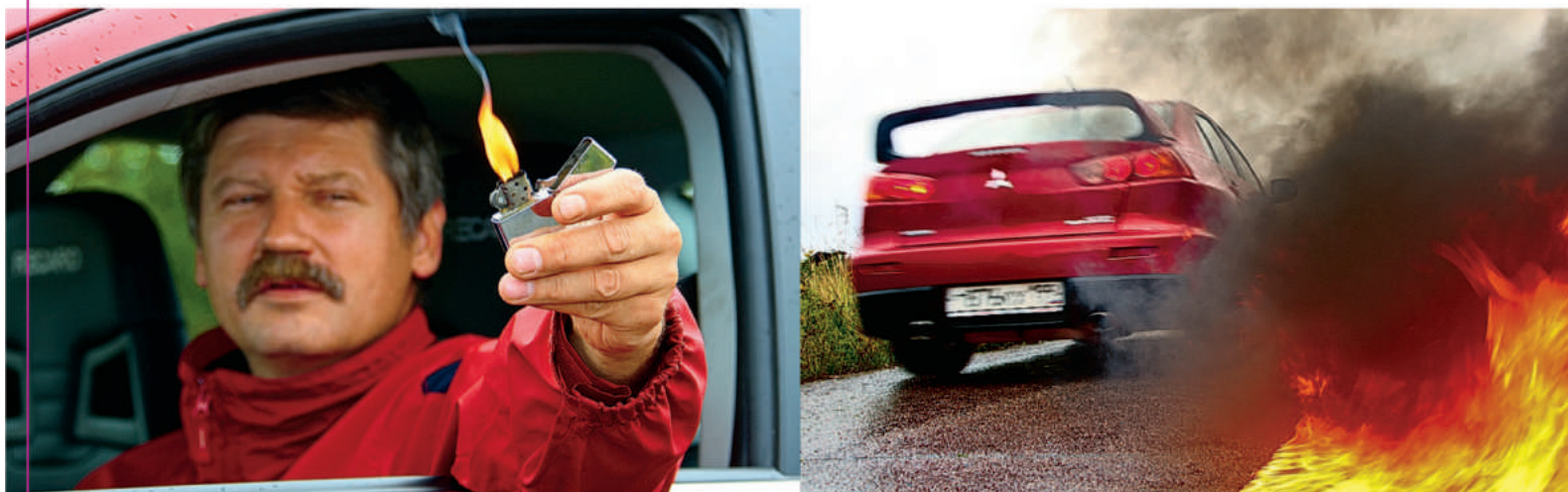
Через мгновение от «Зиппо» вспыхнет бензиновая дорожка и мы с огнем сойдемся в поединке.