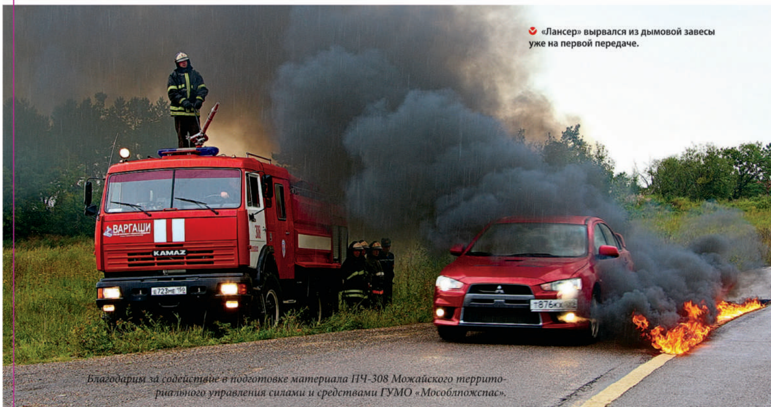
Благодарим за содействие в подготовке материала ПЧ-308 Можайского территориального управления силами и средствами ГУМО «Мособлпожспас».