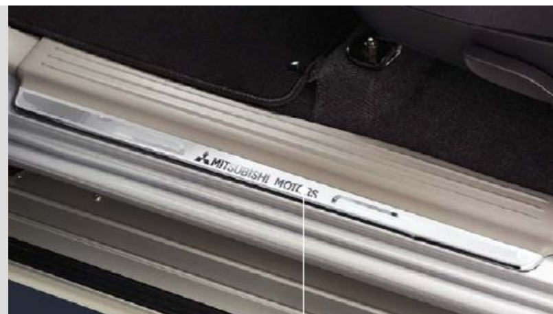
MZ330116 Накладки порогов, 2 шт. Нержавеющая сталь