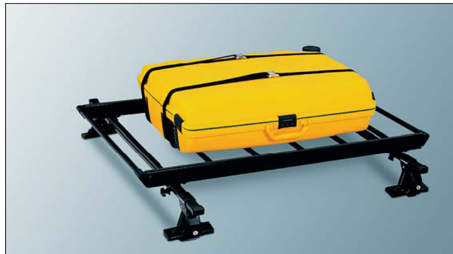
MZ535826 Платформа для багажа (черная сталь, 75x100 см) MZ313061 - адаптер Для установки платформы MZ535826 на дуги багажника