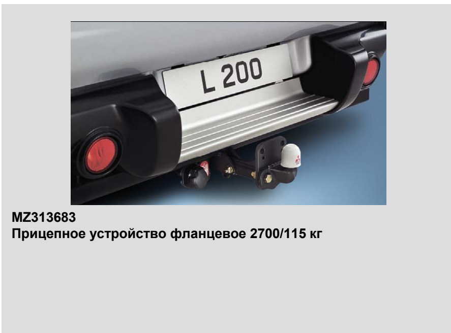
MZ313683 Прицепное устройство фланцевое 2700/115 кг