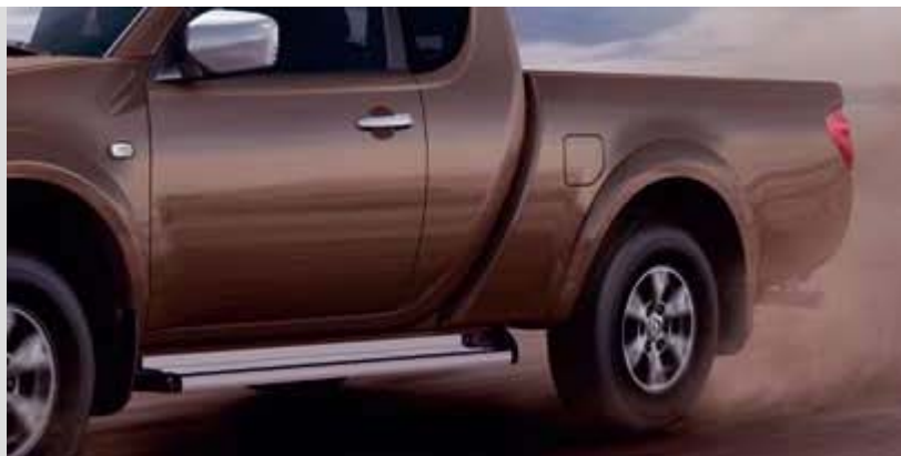
MZ313622 Подножки, к-т (алюминий)