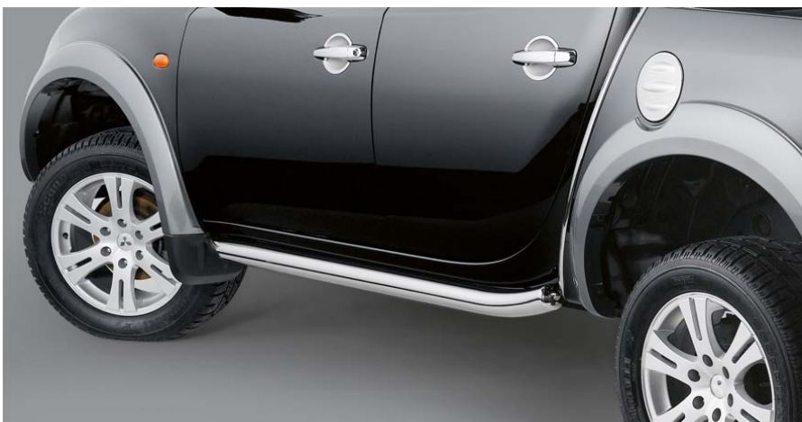
MME31602 Защита порогов, труба 76мм Полированная нержавеющая сталь