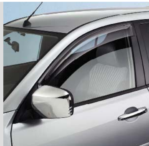
MZ313754 Накладки на зеркала заднего вида, хромированные. В к-те 2 шт.