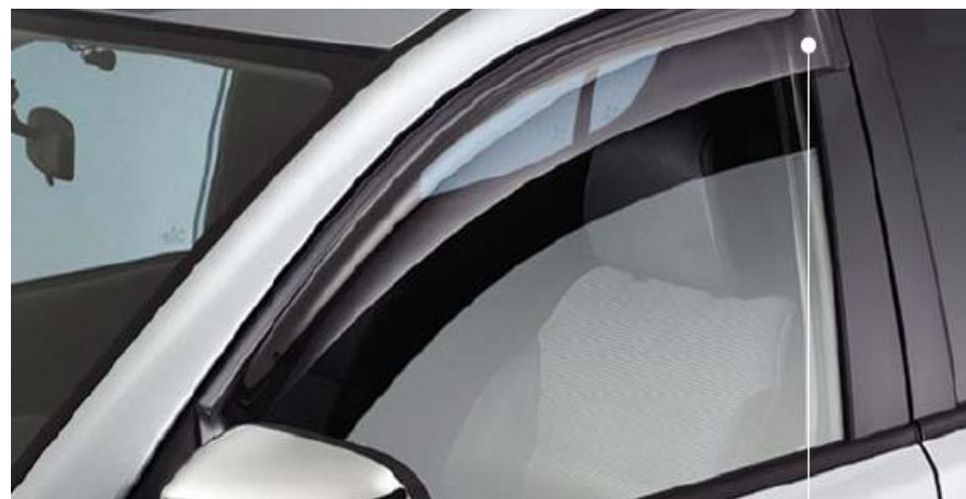
MZ313592 Дефлекторы передних окон 2 шт.