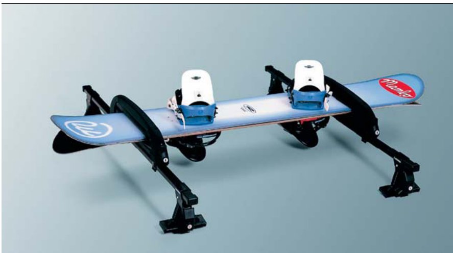
MZ311974 Крепление для 4-х пар лыж или 2-х сноубордов MZ313062 Адаптер для установки крепления на дуги багажника