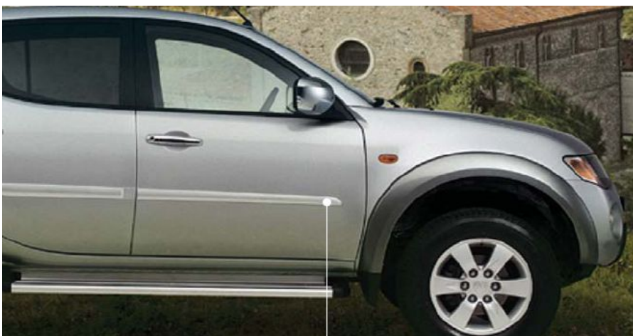
MZ313631 Молдинг боковой, цвет серебристый Может быть покрашен в цвет кузова