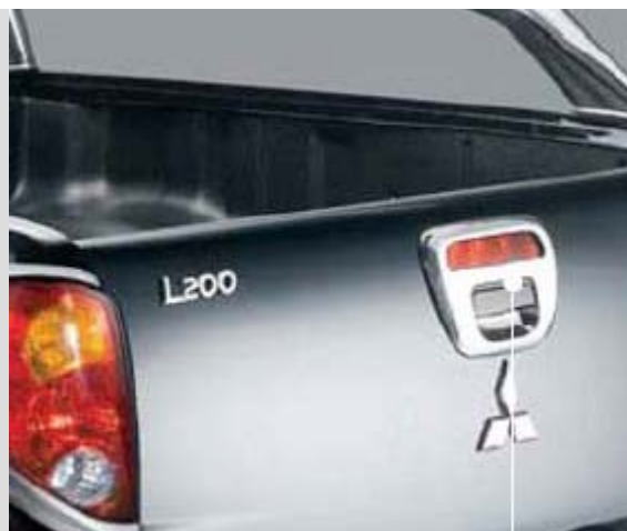
ММЕ31599 Накладка на ручку заднего борта. Полированная нерж. сталь